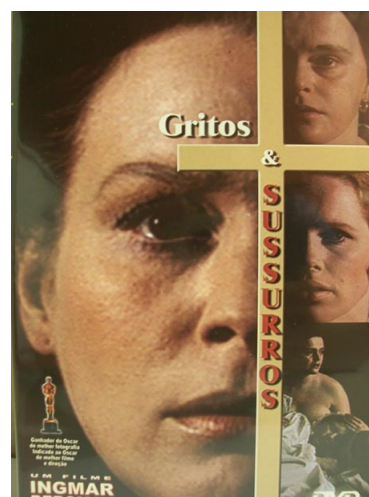
Figura 2: Gritos e Sussurros.

A referência para o Projeto Sonoro 2 é um filme do diretor e cineasta sueco Ingmar Bergman. Viskningar Och Rop (no Brasil, Gritos e sussurros) é um longa metragem de 1972. Em uma casa no campo uma mulher está bastante enferma e recebe cuidados de suas duas irmãs e de uma empregada da família, que precocemente perdeu sua filha e por isso extravaza seu amor de mãe dando o maior carinho possível para aquela moça tão debilitada. Dentro deste contexto lembranças, frustrações e imaginações em um misto de amor e ódio surgem no interior de cada pessoa.